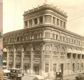
IMMEUBLE DE LA SUN LIFE, MANILLE (À GAUCHE)