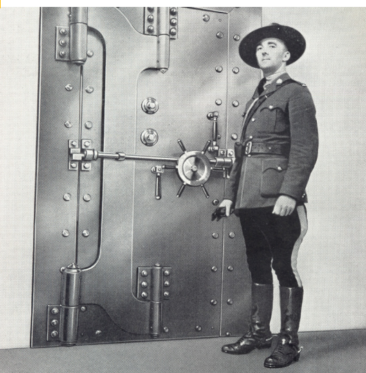
CHAMBRE FORTE AU SOUS-SOL DE L'ÉDIFICE SUN LIFE À MONTRÉAL (À GAUCHE)