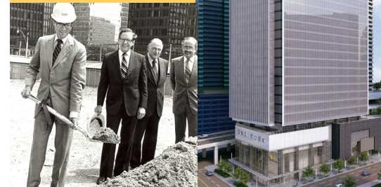
NEW HEADQUARTERS, ONE YORK STREET (LEFT)